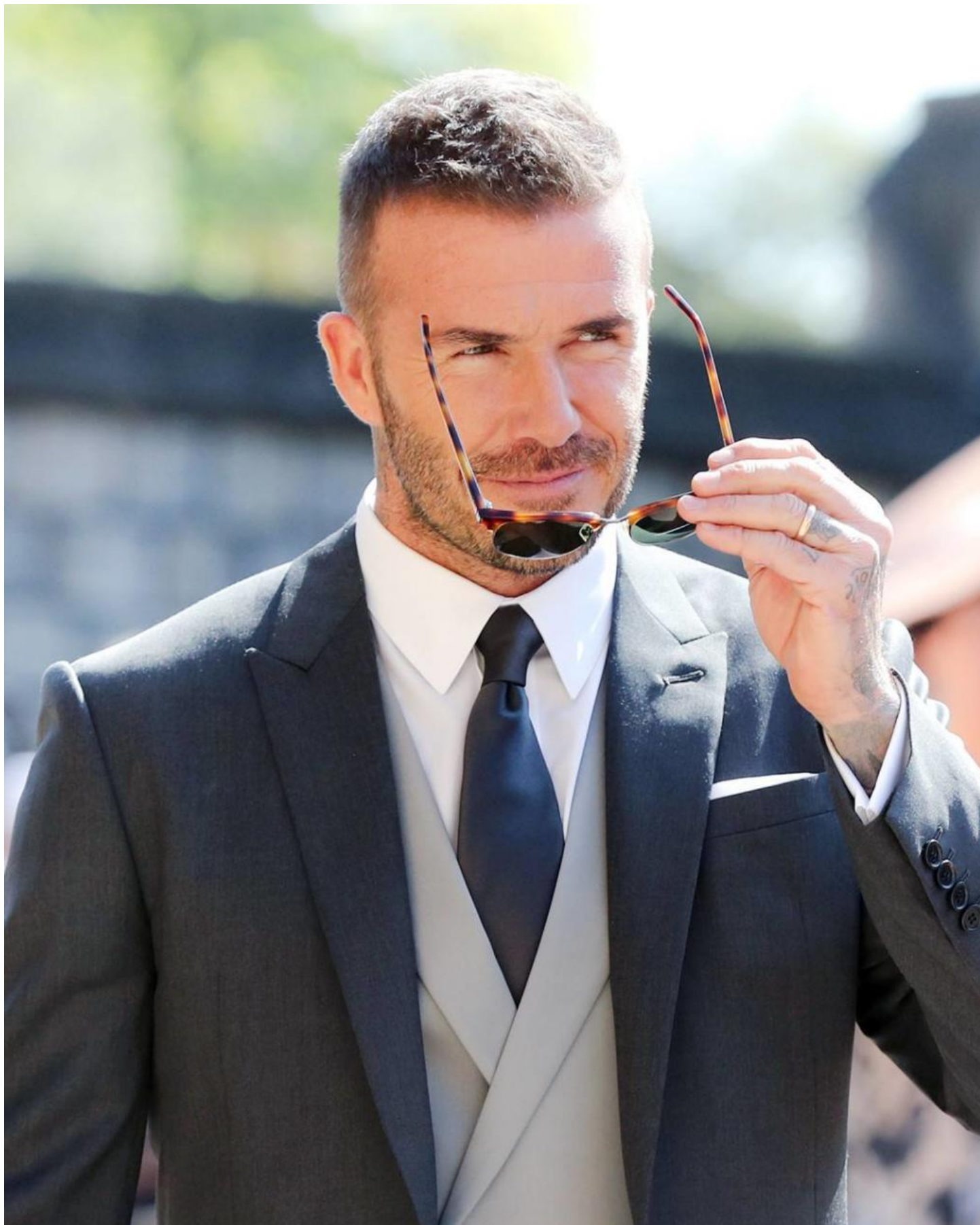
El ex jugador David Beckham tiene la forma de cara más perfecta